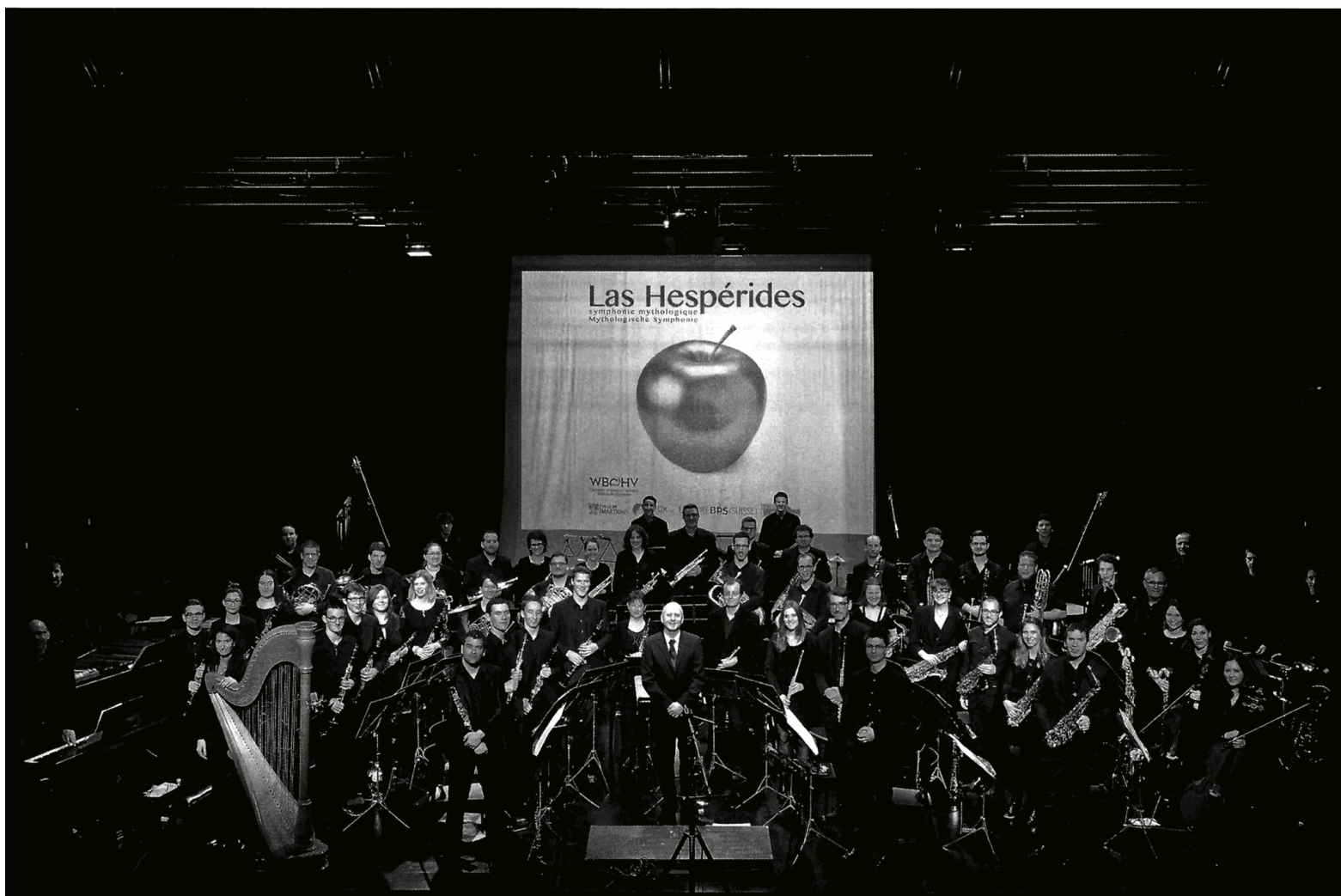
Das WBO präsentierte in seinem dritten Projekt eine mythologische Symphonie. L'OHV a proposé pour son troisième projet une symphonie mythologique.